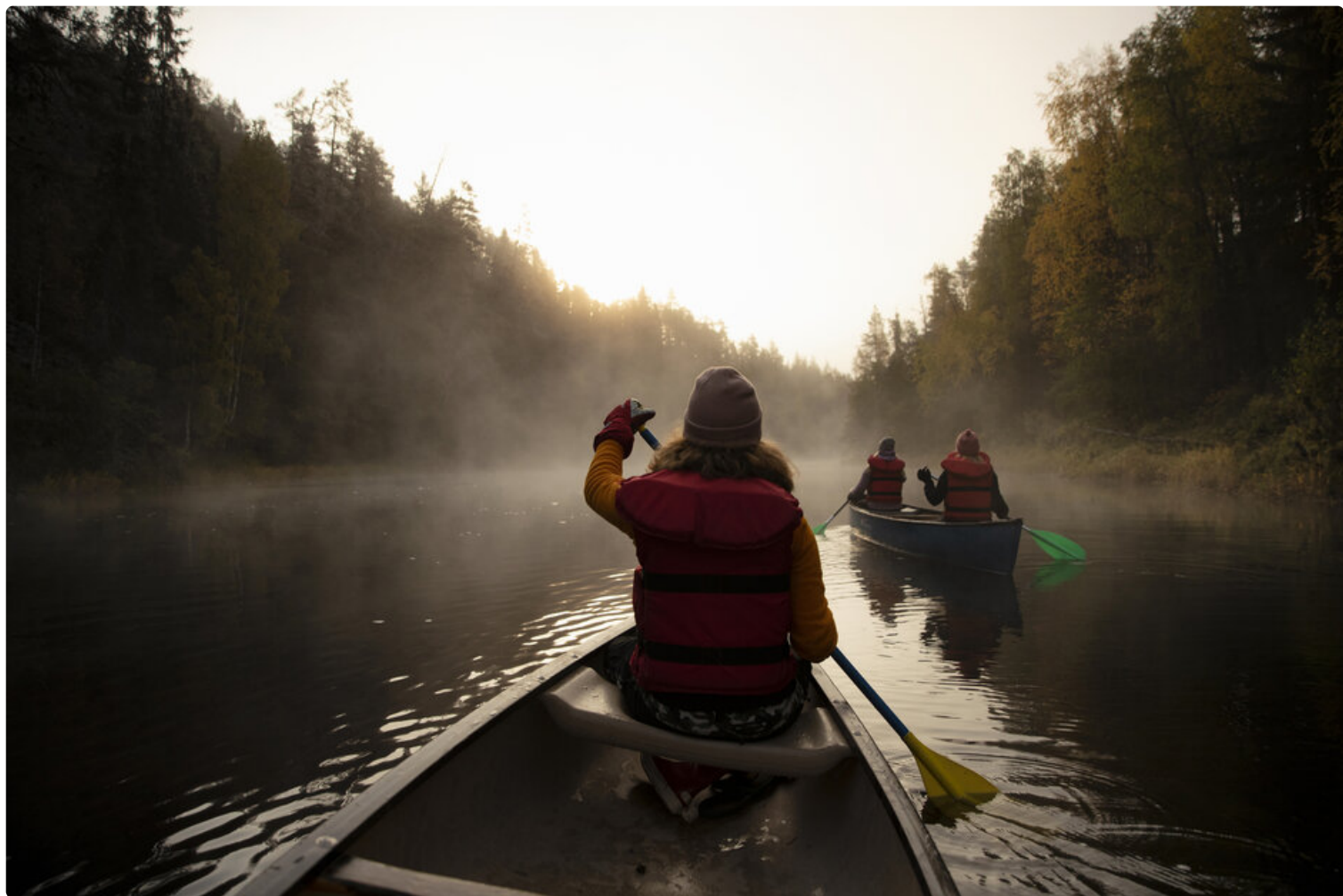
Kuusamon kesää.