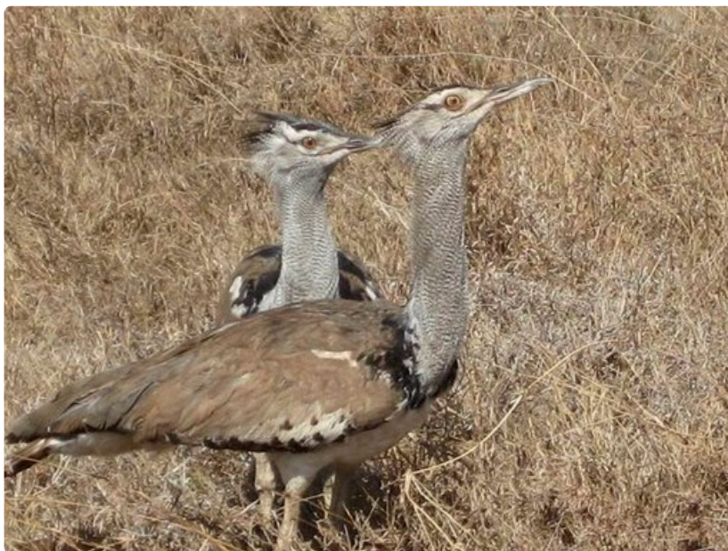
Tansanian kansallislintu on kuningasstrappi.