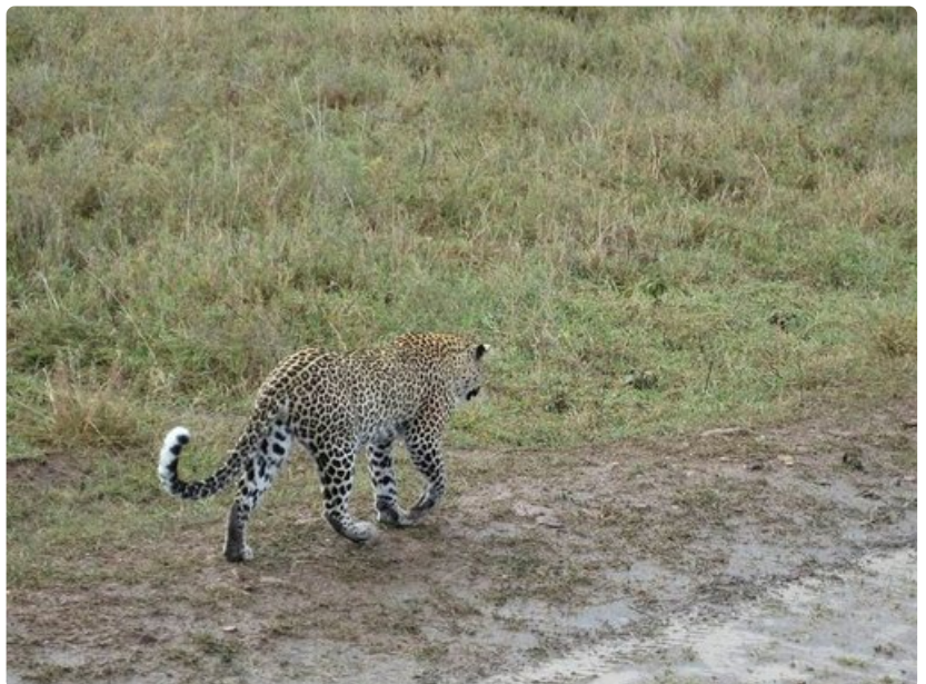
Leopardi ei näytä huomioivan autoa.