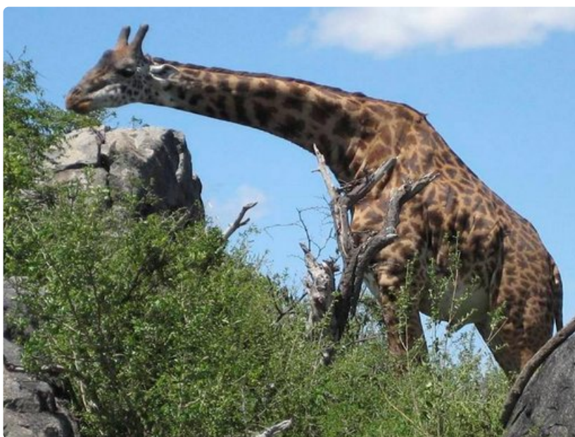
Kirahvi päästää aika lähelle.