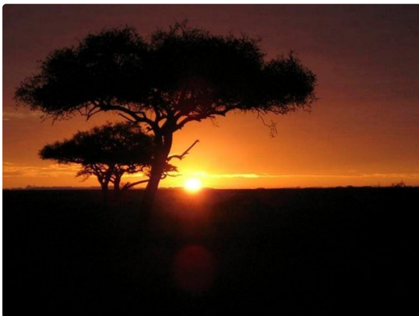
Aurinko nousee savannilla.