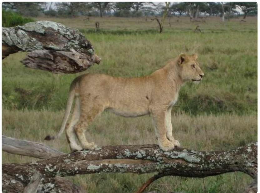
Leijonanpentu tarkkailee ympäristöään puussa.