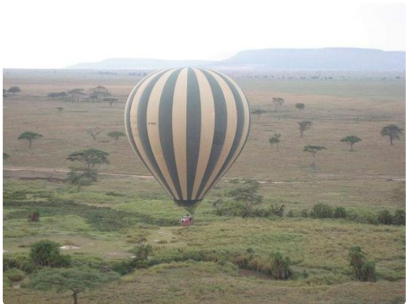
Savannia ja sen elämää pääsee tarkkailemaan ylilmoista.