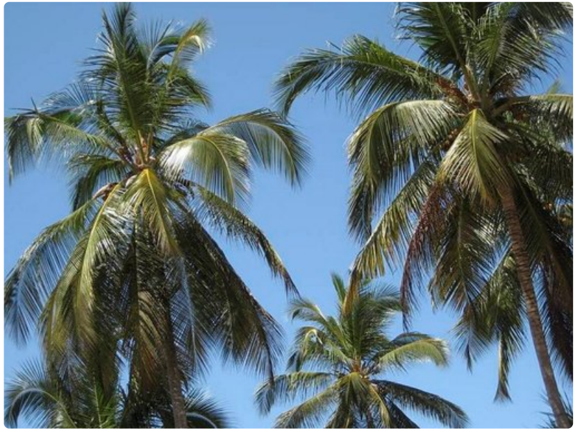
Sansibarilla huojuvat palmupuut.

Eräänä aamuna Lake Maniaralla huoneeni parvekkeen ovi oli hieman raollaan, ja saman tien parvekkeelle hyppäsi isokokoinen urosaviaani, joka yritti aukaista ovea lisää ja tulla sisään. Se oli hurjan näköinen iso harja pystyssä niskassa. Se ei lähtenyt pois, vaikka hyppäsin pystyyn ja huusin suureen ääneen. Vasta kun puolisoni huutoni hätyyttämänä tuli kylpyhuoneesta pyyhe mukanaan hätistämään paviaania, se loikkasi karkuun.