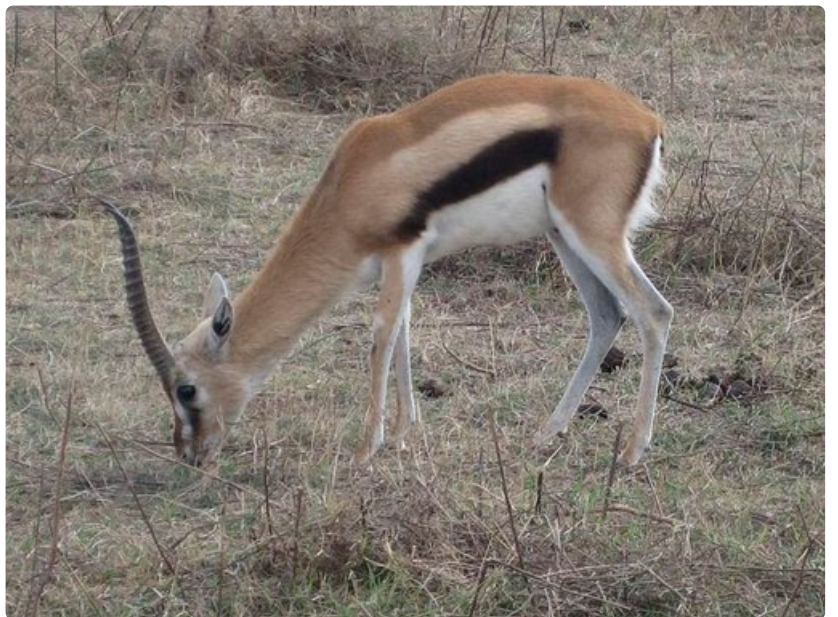
Thomsonin gasellilla on siro ruumis ja solakat raajat.