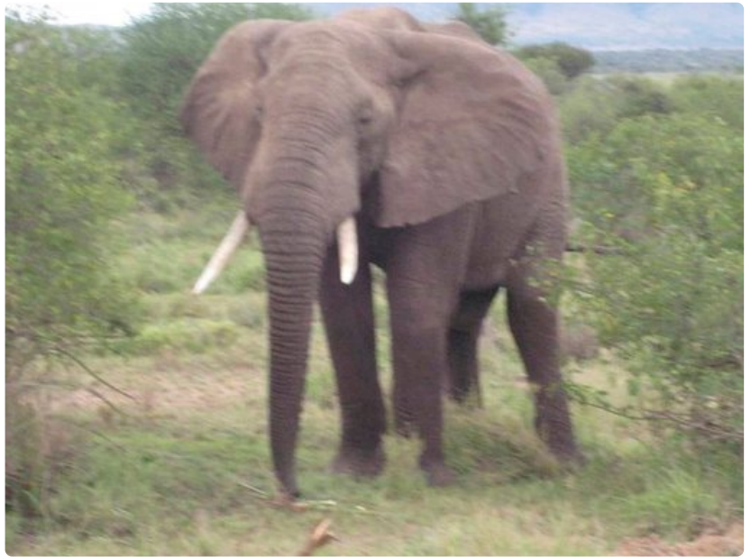
Uroselefanti käyskentelee savannilla ruokaa etsimässä.

Kuumailmapalloretkelle lähdetään jo aamuviideltä, eli pilkkopimeässä, jotta ilmassa oltaisiin yhtä aikaa auringonnousun kanssa. Pari isoa hyeenaa vilahtaa autojen valojen ohi. Ilmassa on jännitystä ja erityisen suurta odotuksen tunnetta, saammehan nähdä savannin yläilmoista käsin.