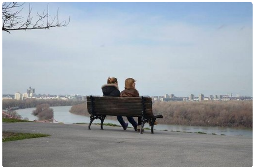
Rauhoittavat jokimaisemat Belgradin linnoitukselta katsottuna.