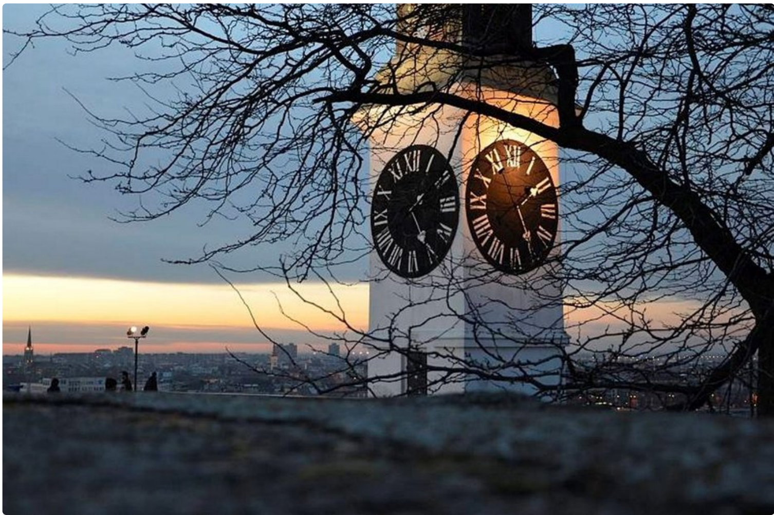
Yksi tärkeimmistä Novi Sadin maamerkeistä on Petrovaradinin kello. Sen erikoisuus on pitkä tuntiviisari ja lyhyt minuuttiviisari.