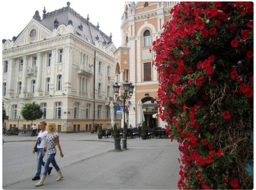
Novi Sadin keskusaukio.