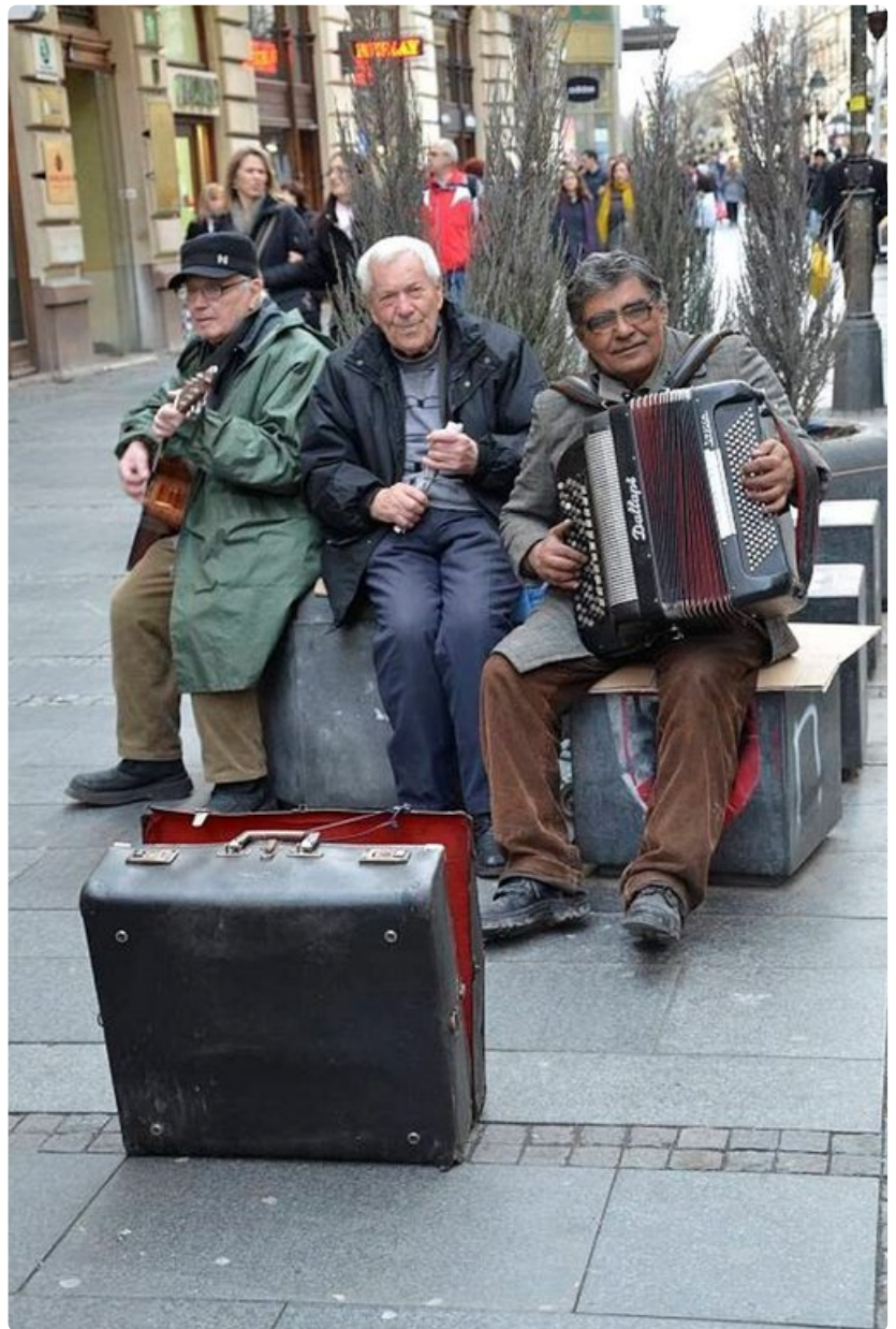
Belgradin kaduilla soi aina. Katusoitajat ovat suosittuja kävelykadulla, Knez Mihailovalla, kesäisin ja talvisin, päivisin ja öisin.