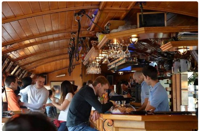
Kahviloissa riittää aina asiakkaita.