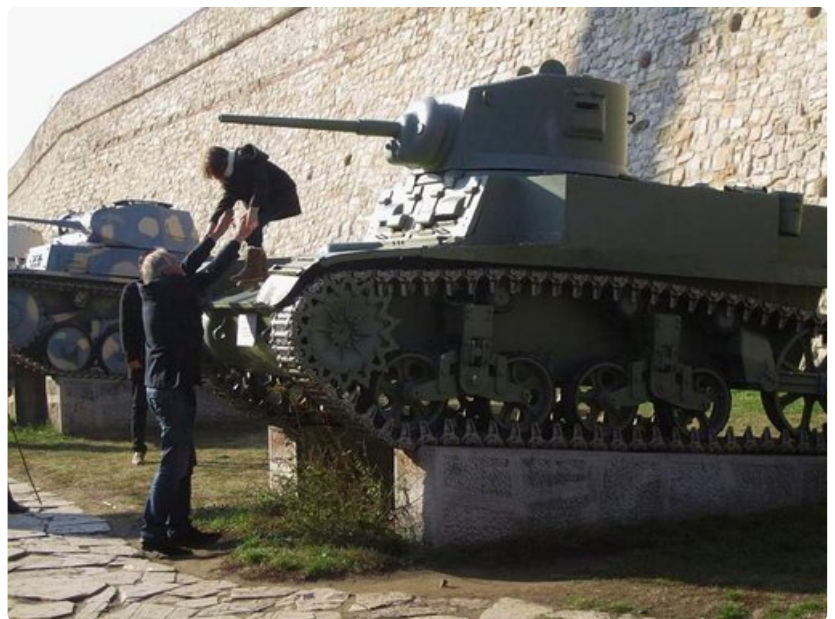
Tankkeja sotamuseon edustalla.