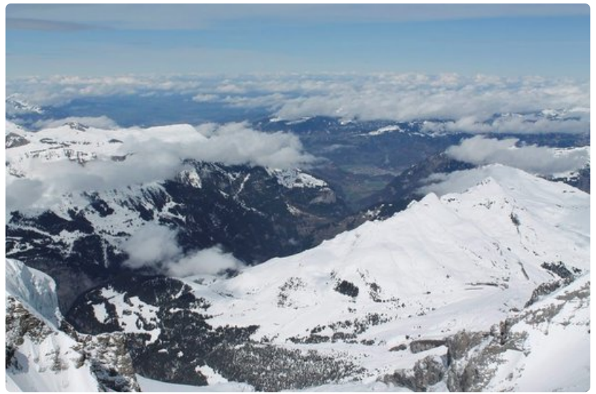
Aletsch Glacierin huiput aukeavat Sphinx-rakennuksen terassilta.

Historia: Ensimmäiset suunnitelmat elokuussa 1893, rakennuslupa 21.12.1894, rakennustyöt käynnistyivät 27.7.1896, aseman avajaiset 1.8.1912.