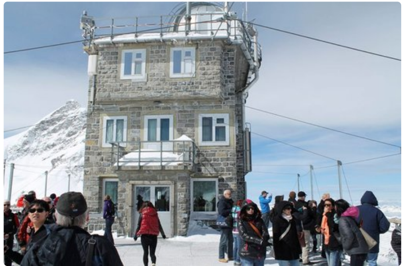
Sphinx-rakennus on palvellut sää- ja tutkimusasemana vuodesta 1931 lähtien. Observatorio rakennettiin 1950.