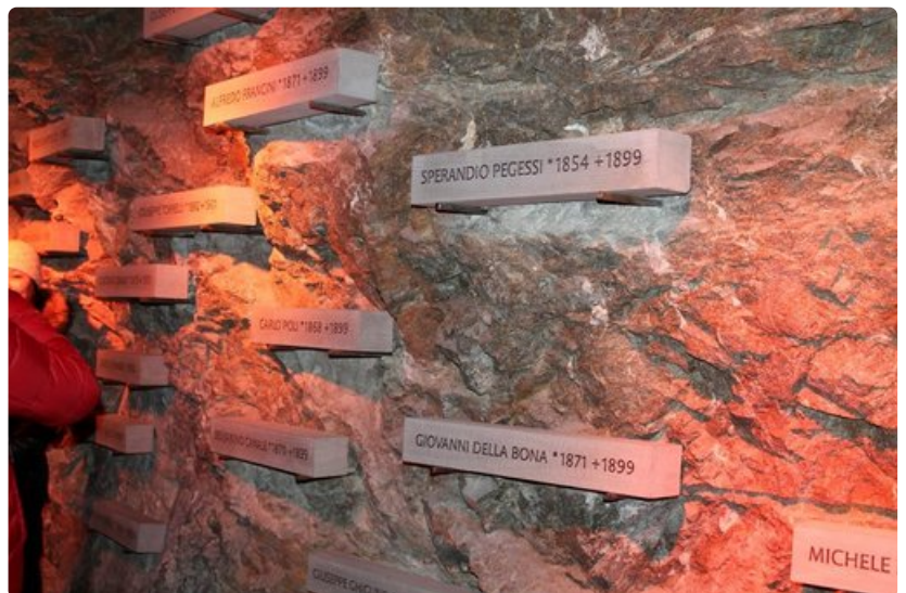
Vuori vaati myös uhrinsa. Alpine Sensation on myös kunnianosoitus rakentajille. Käytävän seinillä on rakennustöissä kuolleiden työmiesten nimet.