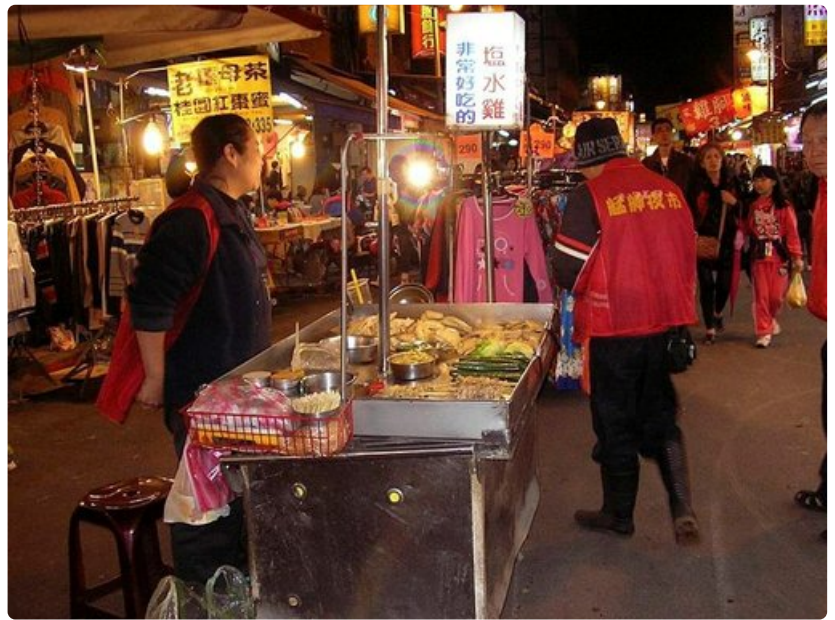
Taipeilaisen iltatorin elämää.

Taipeiissa on hotelleja joka lähtöön. Siellä ovat eräät maailman kiistattomista huippuhoteleista kuten legendaarinen Grand Hotel, joka on joskus luokiteltu maailman ykköseksi. Luksushoteleissa on luonnollisesti luksushinnat. Toisaalta keskitason hotellit jopa keskikaupungilla ovat kohtuullisen edullisia. Parin viikon valmismatkan Helsingistä Taipeihin saattaa saada jopa puolellatoistuhannella eurolla.