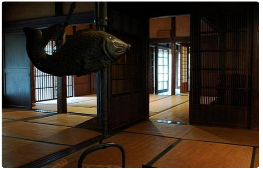
..ja savunhajuisia maataloja.