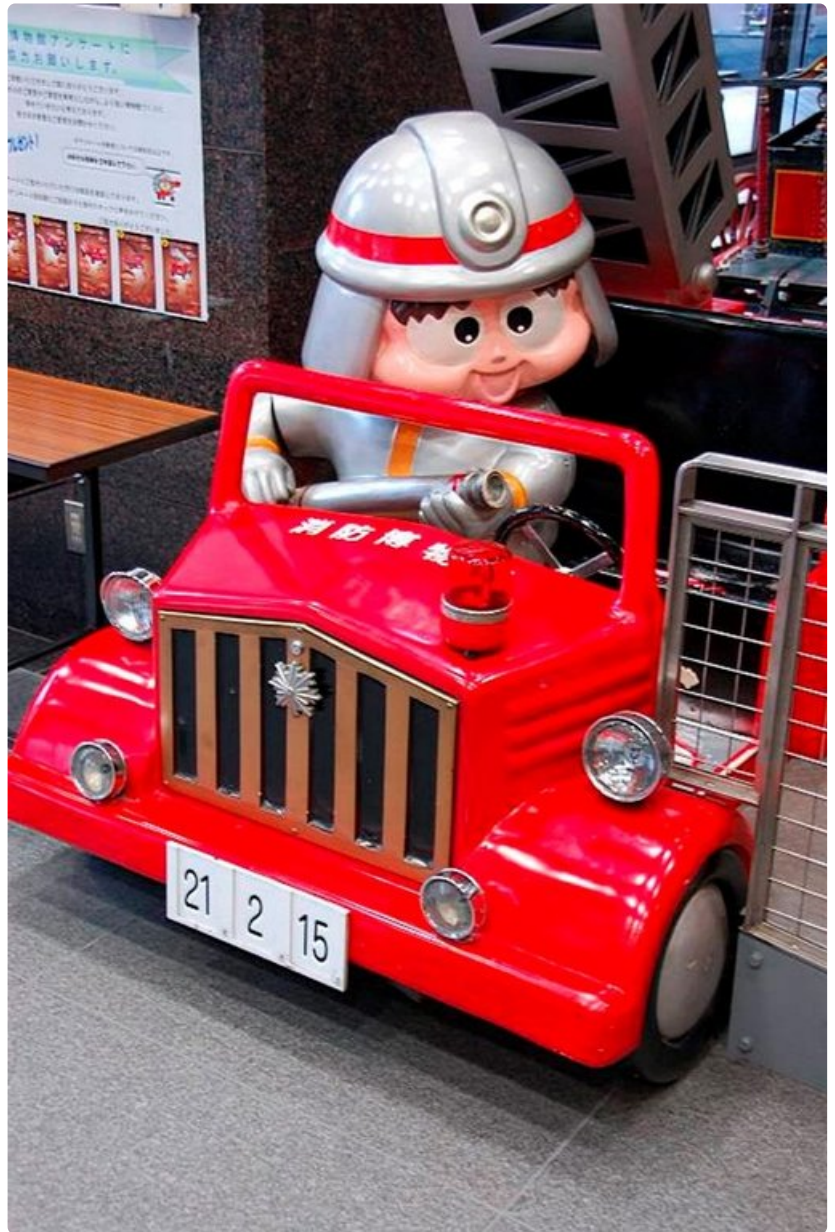
Palomuseo on joka pojan paratiisi.