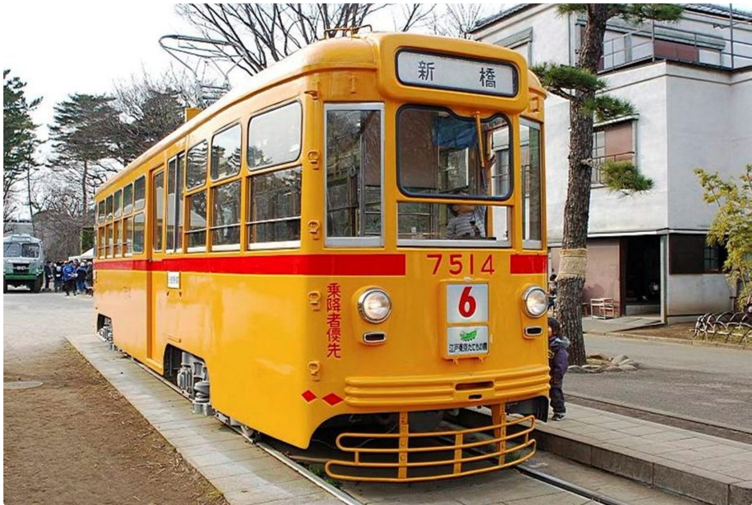
Vanhan raitiovaunun ohjaamistakin saa kokeilla.