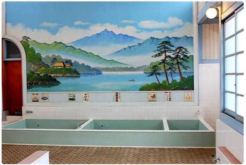
Kylpytunnelmaa Koganein puistossa.