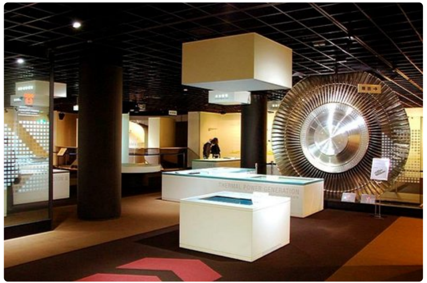
Sähkömuseosta elektronista asiaa kaikenikäisille.

Kierros kannattaa aloittaa pohjakerroksesta ja ensimmäisestä kerroksesta, joissa esillä on antiikkiautoja. Kronologia säilyy, jos tämän jälkeen matkaa kuudenteen kerrokseen ja siitä alaspäin. Näyttelyn voi päättää hissikurkkaukseen kymmenennen kerroksen näköalatasanteelle.