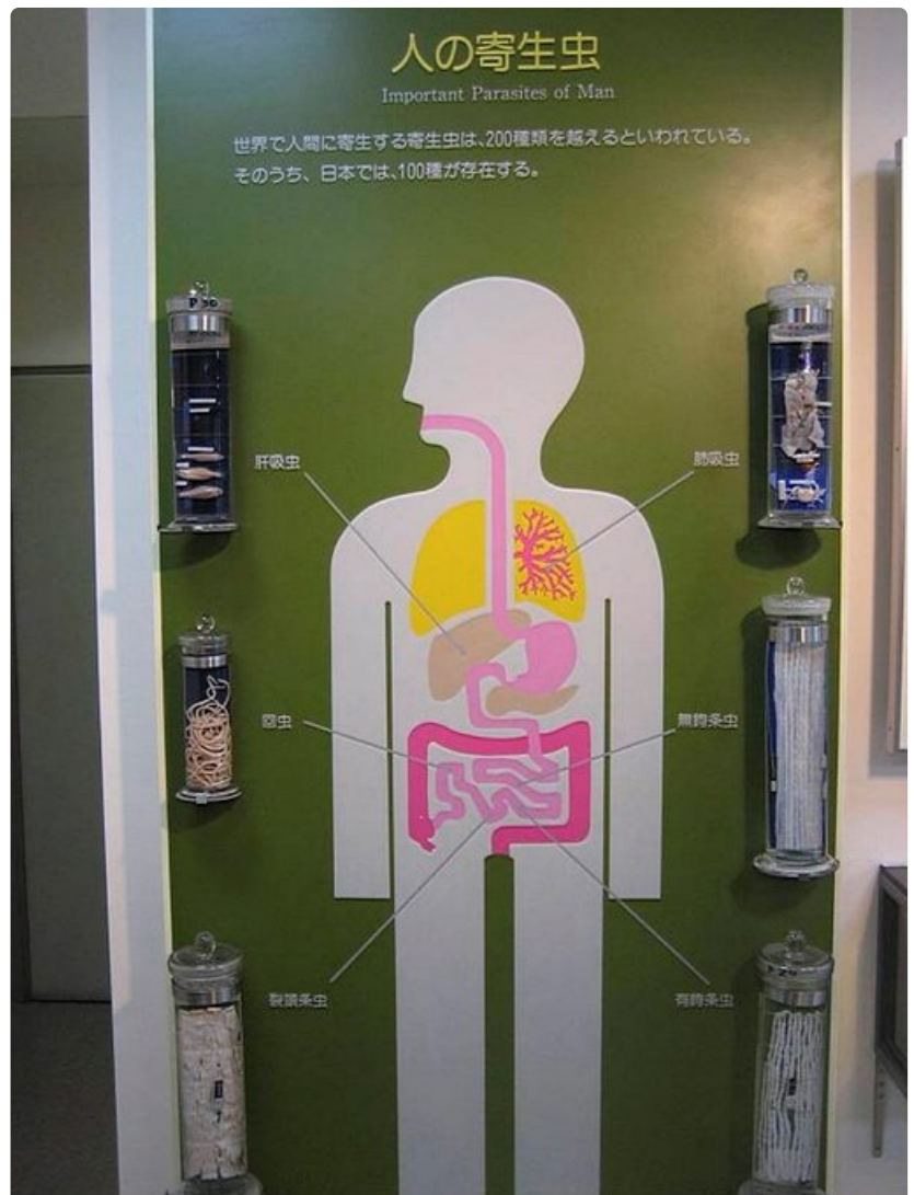
Parasiittimuseo on opettavainen kokemus ravinnon kiertokulusta.