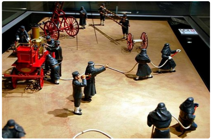
Pienoismalleja entisaikojen tulitoimista.