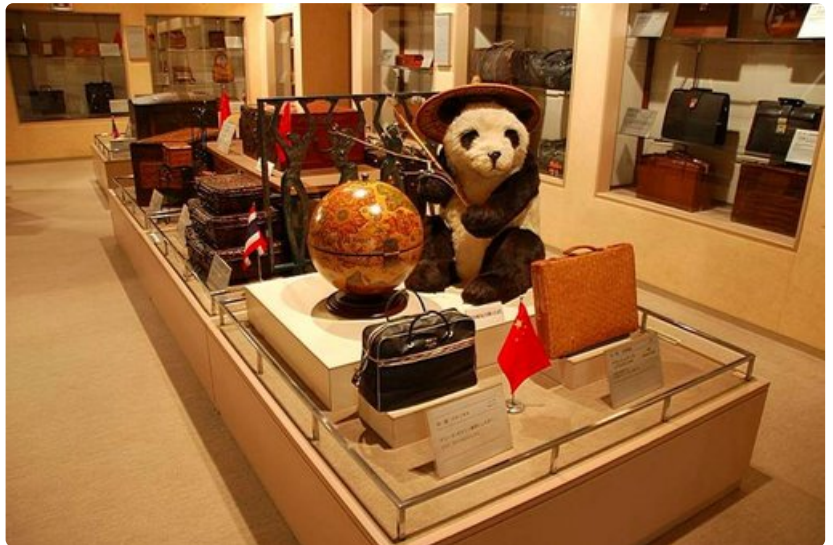
Laukkumuseossa on esillä laukkuja moneen lähtöön.