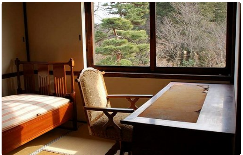
Aitoja historiallisia koteja..