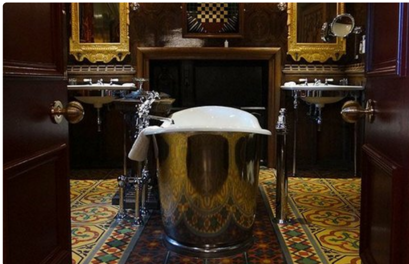
Witchery by the castle hotelli Skotlannissa.