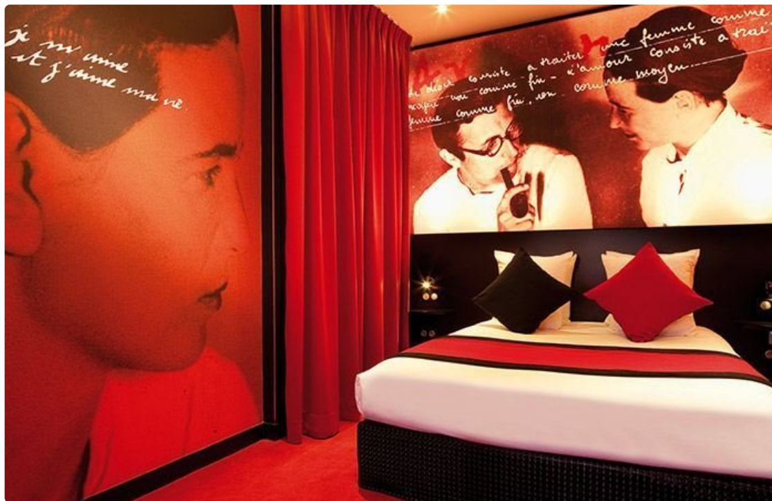
Hotelli Montmartre mon amour Pariisissa.