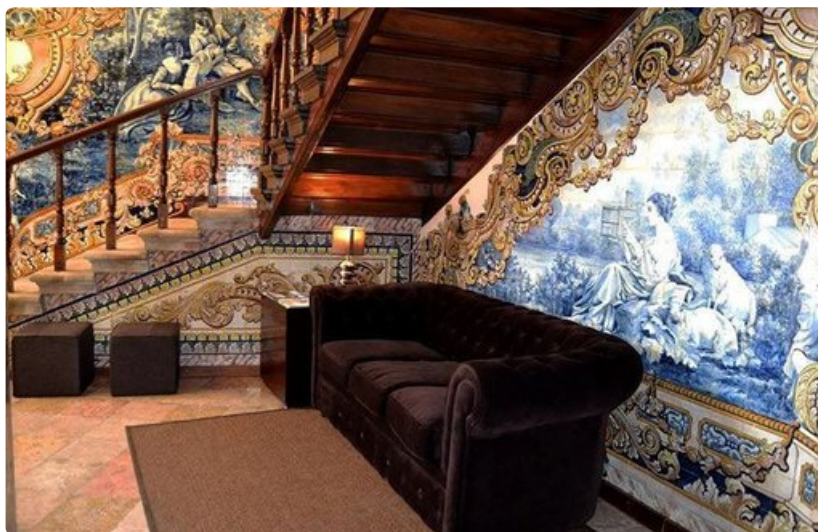
Coimbra portagem hotel Portugalissa.