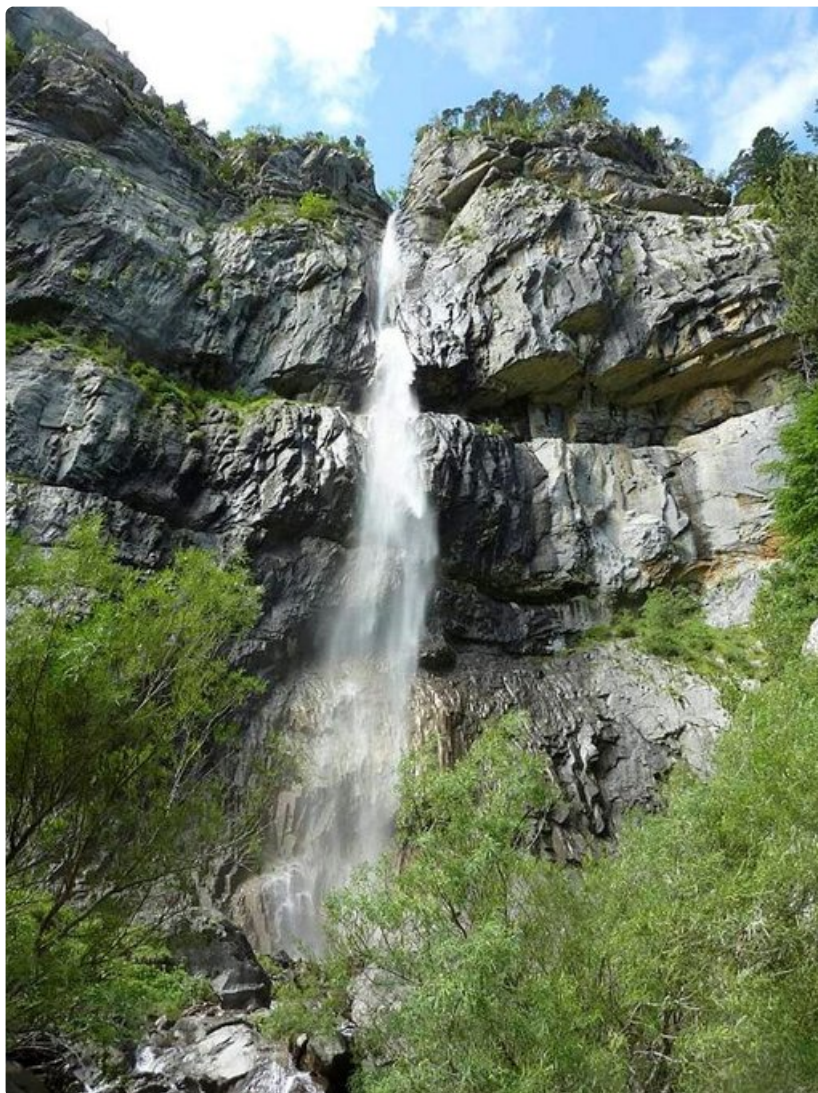
Pyreneillä vaeltavat voivat pysähtyä ihailemaan vesiputouksia ja vuoristopurojen