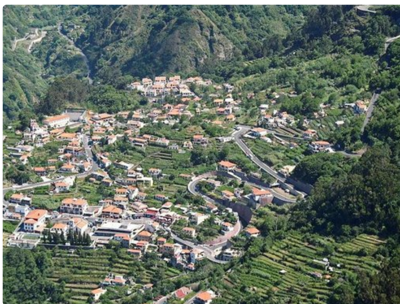
Madeira on ennen kaikkea aktiivilomailevan hääparin kohde.