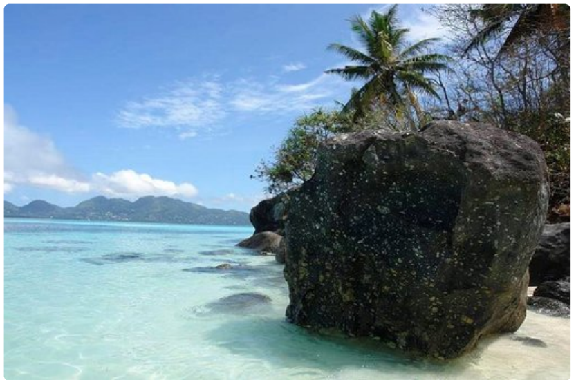
Jos haluaa häälomaltaan parasta, niin Seychellit kuuluu listan kärkeen. Rauha ja romantiikka on taattu!