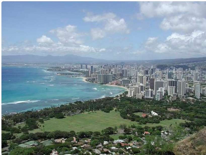
Honolulu on Havaijin kosmopoliittinen keskus.

Pulau Tiomanille pääsee lentämällä Kuala Lumpurista Berjaya Airilla. Lennot Malesiaan alk. 1 000 euroa/hlö