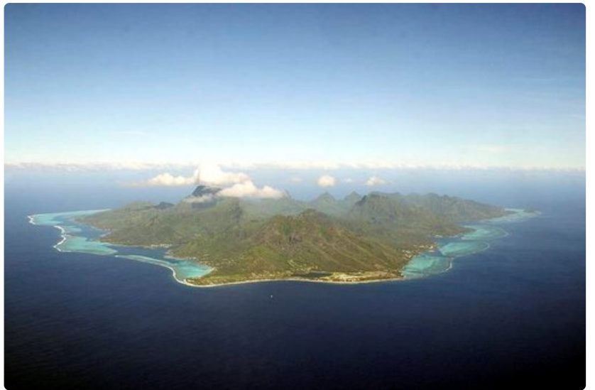
Tahiti on unelmien kohde. Varsinkin kuvankaunis Bora Bora tarjoaa ikimuistaisen hääloman.