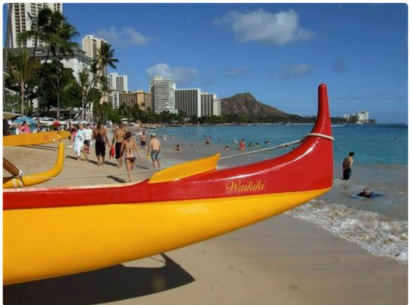
Lainelautailu, tulivuoret ja shoppailu ovat Havaijin merkkituotteita. Aloha!