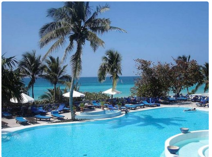
Kuubassa sekoittuvat musiikki ja vanhan ajan tyyli. Myös rannat ovat ensiluokkaiset.