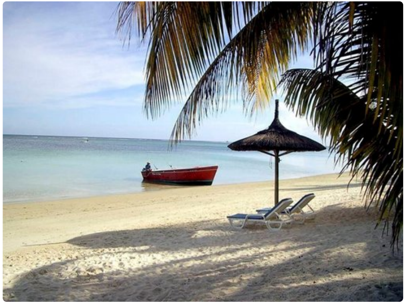
Karibian helmeksi kutsuttu Barbados pitää kauneudellaan häähunun takuulla yllä.

Fidžille pääsee helposti Australiasta tai Uudesta-Seelannista esimerkiksi osana maailmanympärimatkaa. Lennot noin 2 200 euroa/hlö. Pakettimatkoja järjestää muun muassa Helin Matkat.