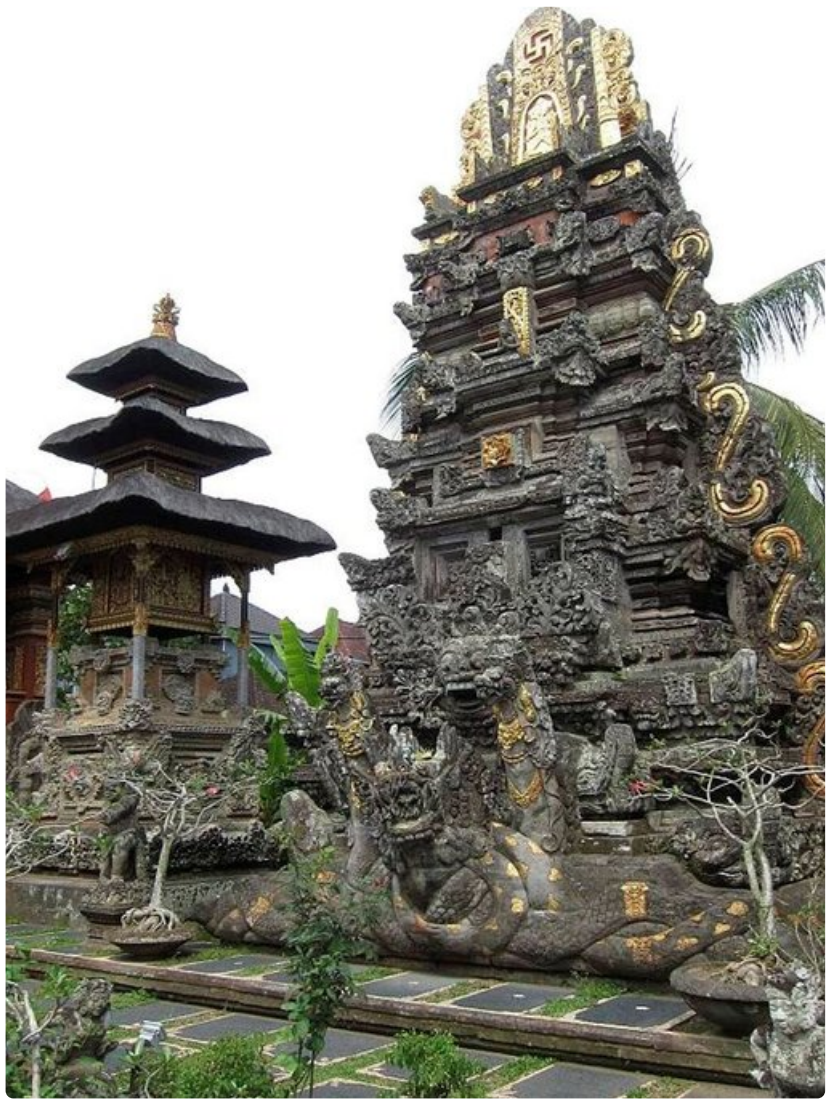
Bali uhkuu romantiikkaa kauniilla riisipelloilla ja tempeleillä.