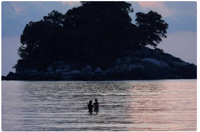
Pulau Tioman takaa häämatkalaisille rauhalliset puitteet Kaakkois-Aasian kauneimmilla rannoilla.