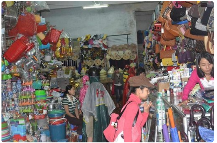
Basaarityyppinen katettu torikeskus käsitti tuhansia neliömetrejä.