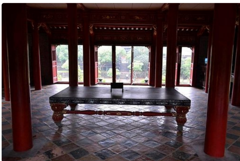
Näkymä Minh Mangin hautamuistomerkiltä.