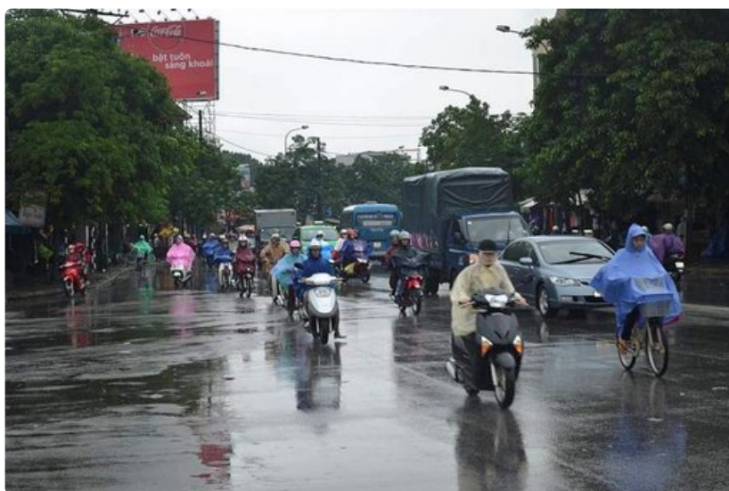
Hue on liikenteen osalta hiljainen Saigoniin verrattuna.

Historiallisten nähtävyyksien lisäksi Huessa voi tutustua myös Vietnamin nykyelämään. Ostoksia voi tehdä putiikeissa, kadunvarsikojuissa tai täyteen ahdetussa basaarissa, jossa tunnit kuluvat sukkelasti.