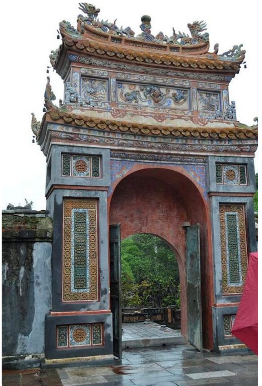
Tu Ducin mausoleumin sisäänkäynti tapahtuu jyrkän portin kautta. Linnoituksen muurin rappaukset kaipaavat korjausta.