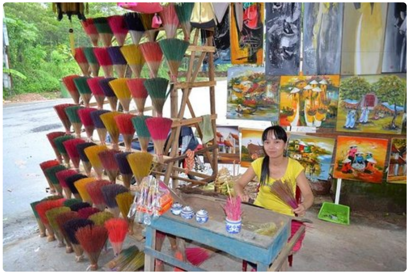
Tehdasmymälän suitsuketuotantoa ja -myyntiä hoiti sama henkilö.