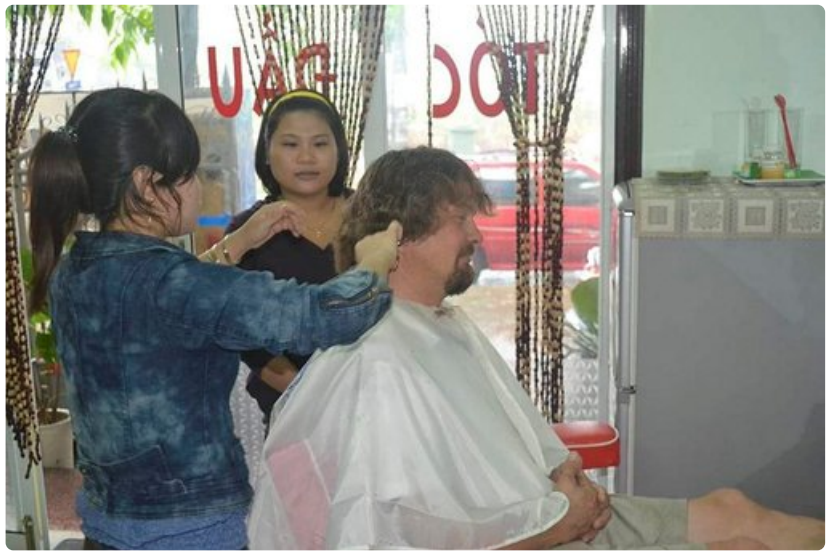
Taustalla oleva parturi aloitti hiusten leikkaamisen, mutta luovutti sitten työn rohkeammalle kollegalleen.