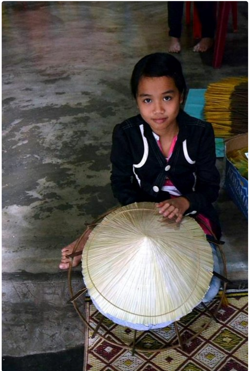
Hatuntekijällä kuluu yli kuusi tuntia päähineen valmistamisessa.