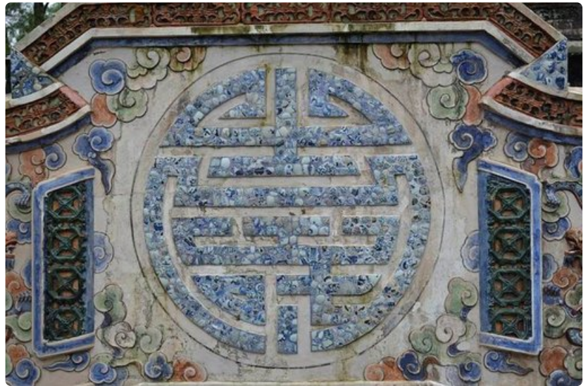
Linnoituksesta poistuttaessa saman paaden toinen puoli toivottaa hyvää kotimatkaa.