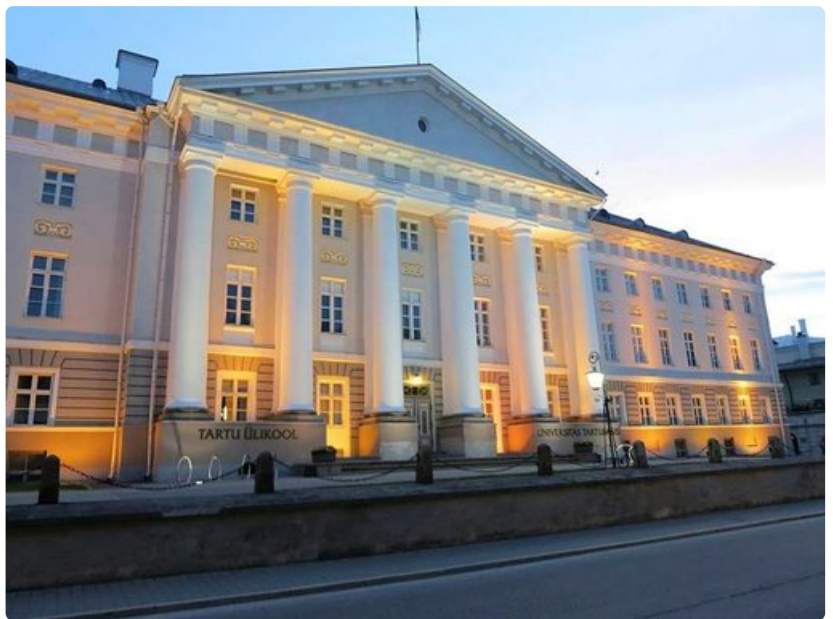
Tarton yliopiston päärakennus.