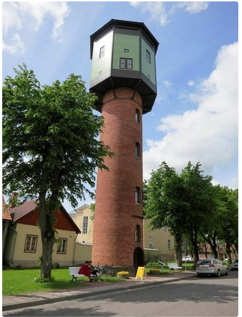
Viljandin vanhaan vesitorniin pääsee kiipeämään.