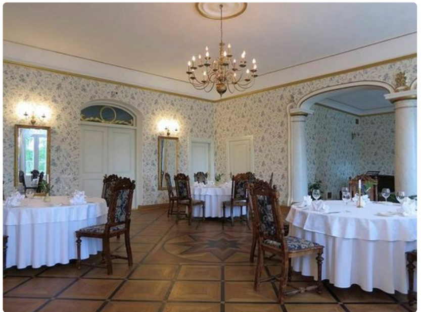
Padisen kartanon hienoon ravintolasaliin otettiin reissussa rähjäntynyt vieraskin vastaan ystävällisesti.

Pärnu on Viron kesäkaupunki ja suosittu suomalaistenkin