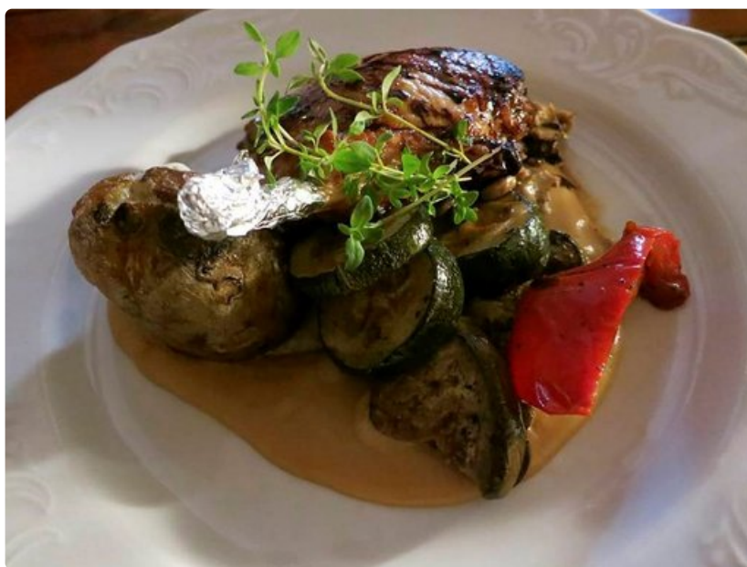
Maistuva ruoka-annos Pärnun Postipoiss-ravintolassa.