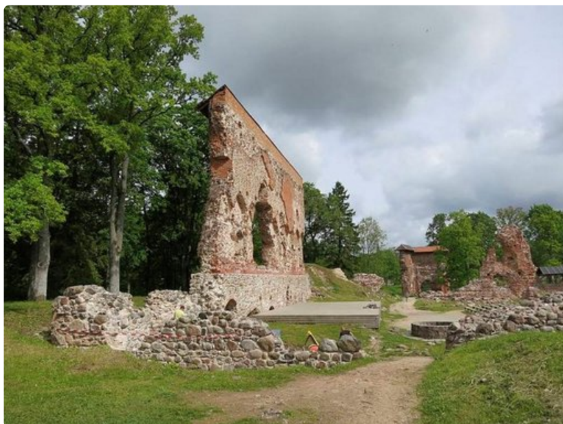
Viljandin linnan rauniot.