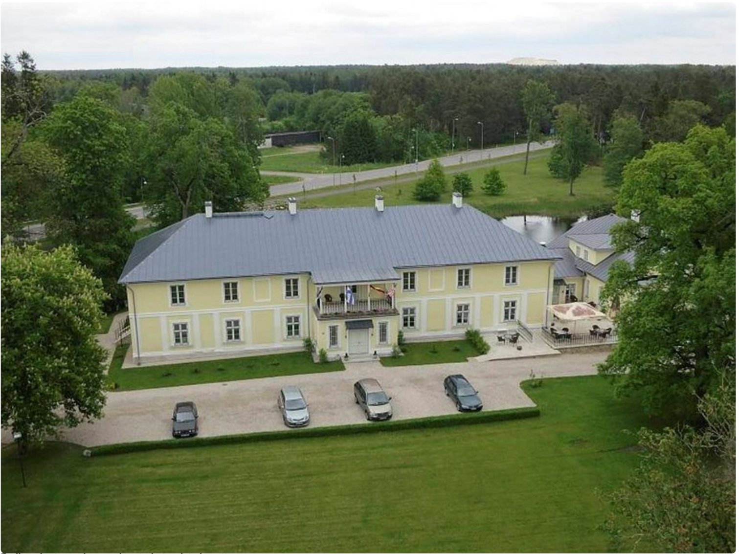
Padisen kartanorakennus luostarin tornista kuvattuna.