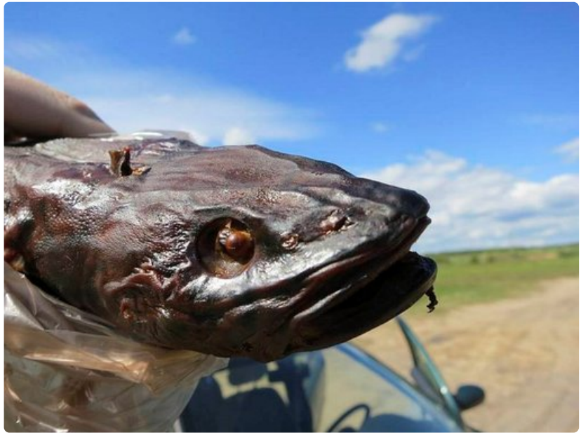
Peipsi-järven rannalla kannattaa maistaa savukalaa, jota voi ostaa tien varren kojusta.