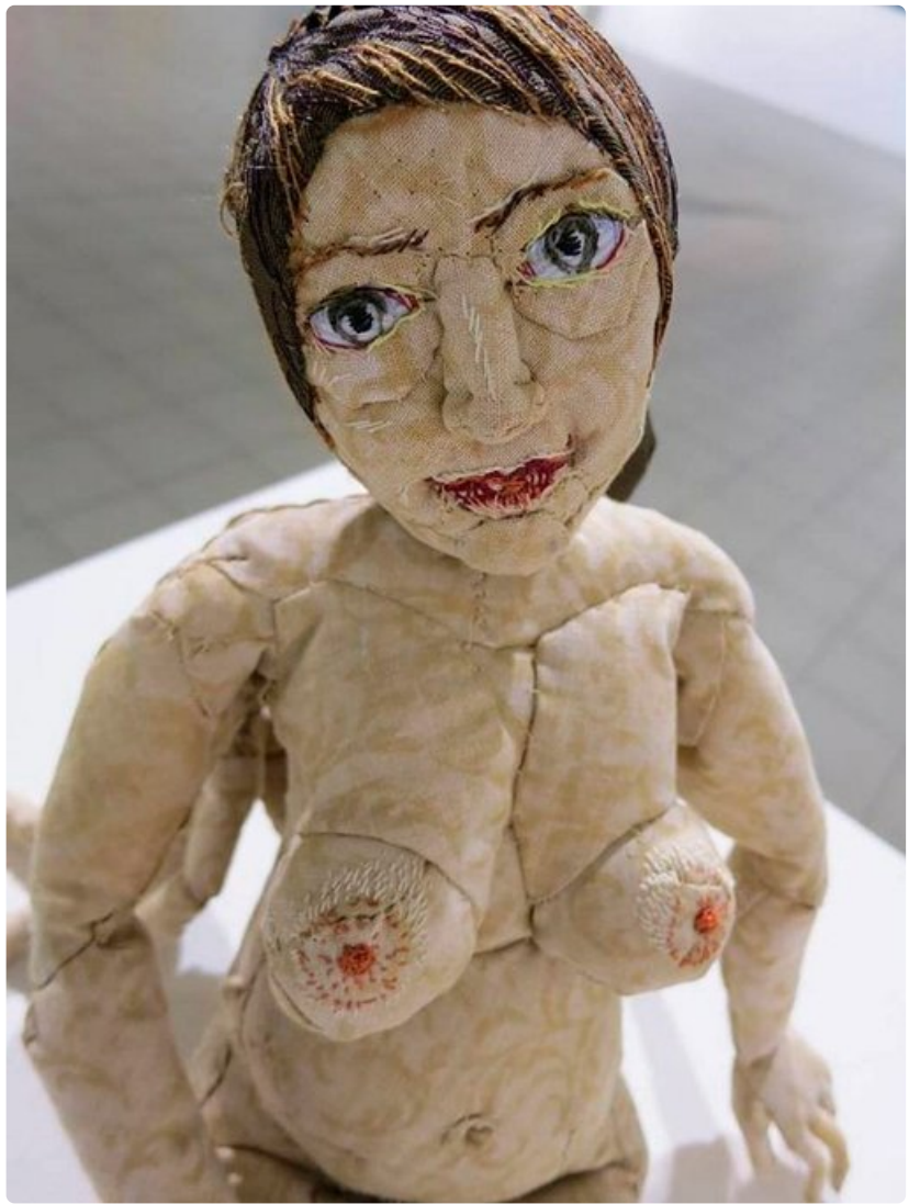
Modernia taidetta Pärnussa.