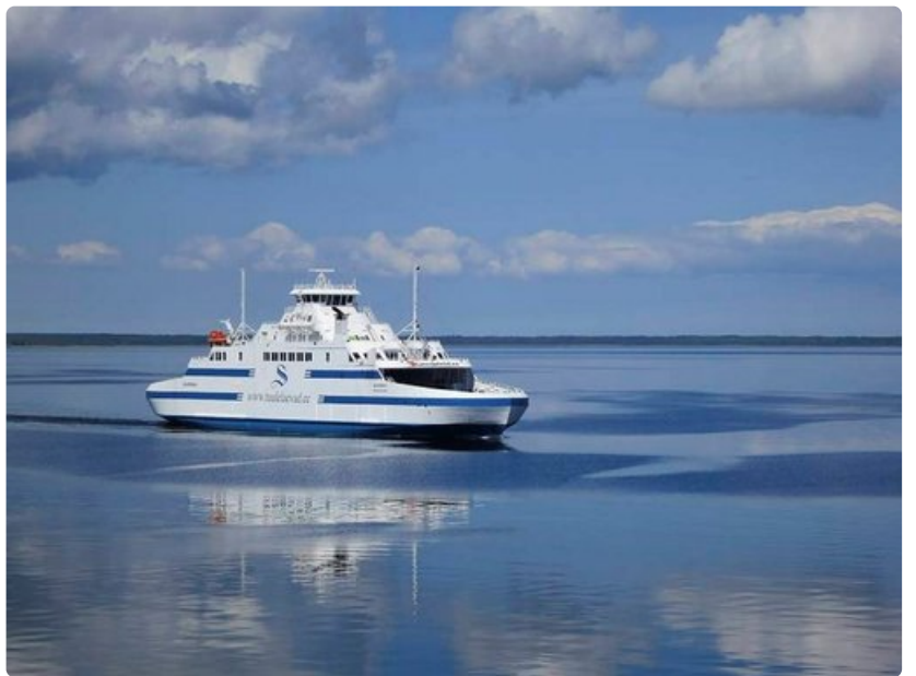
Mantereelta Muhuun pääsee puolen tunnin välein ja lipun voi hankkia etukäteen netistä.