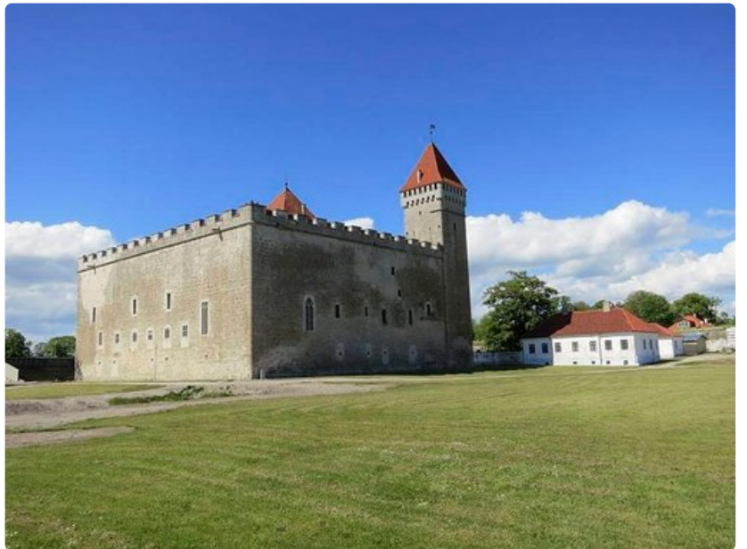
Piispanlinna on Kuessaaren rkittävin nähtävyys.