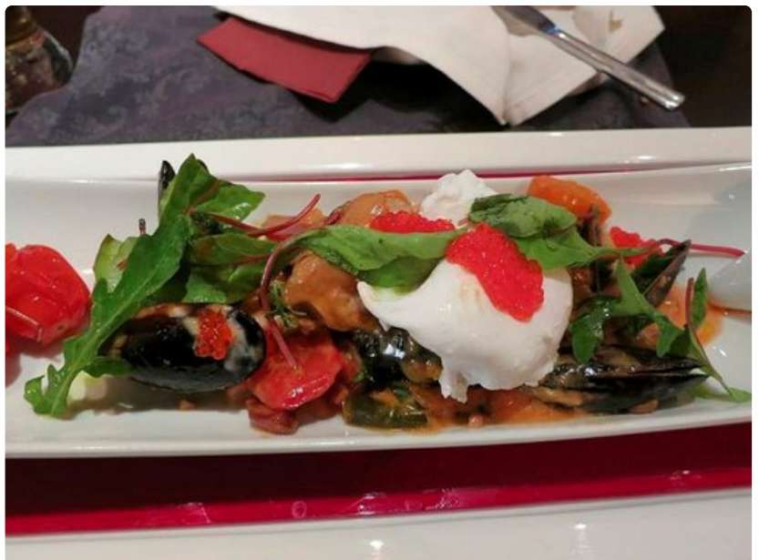
Ravintola Mokan herkullinen ruoka-annos.